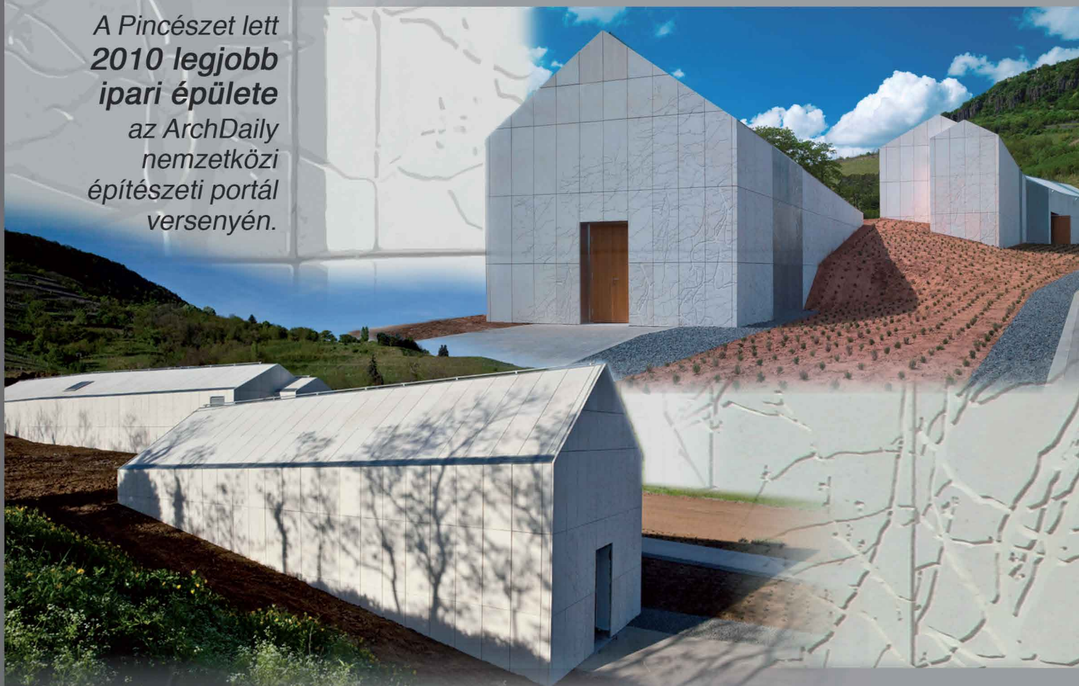
BORFELDOLGOZÓ - BADACSONY Tervező: Kis Péter & Molnár Bea

A Pincészet lett 2010 legjobb ipari épülete az ArchDaily nemzetközi építészeti portál versenyén.