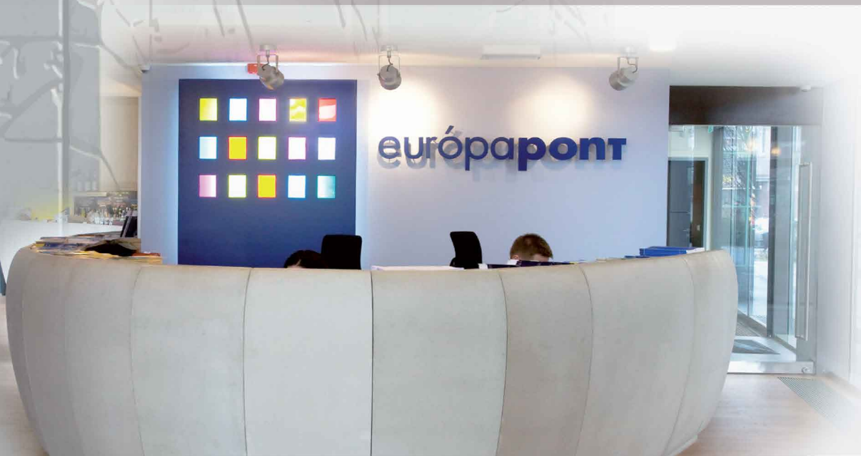
EURÓPA TANÁCS ELNÖKSÉGE 2011 - RECEPCIÓS PULT Millenáris Park

A Pincészet lett 2010 legjobb ipari épülete az ArchDaily nemzetközi építészeti portál versenyén.